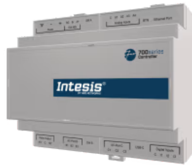
Kaskadenregler für Samsung EHS - Bis zu 8 A2W-Geräte

Der Intesis Cascade Controller verwaltet effizient mehrere Luft/Wasser-Wärmepumpen und sorgt so für optimale Energieeinsparungen. Es überwacht ständig die verfügbaren Tanks und die Außentemperatur, was zu einer präzisen Temperaturregelung und einem effizienten Lastausgleich zwischen allen Einheiten führt.