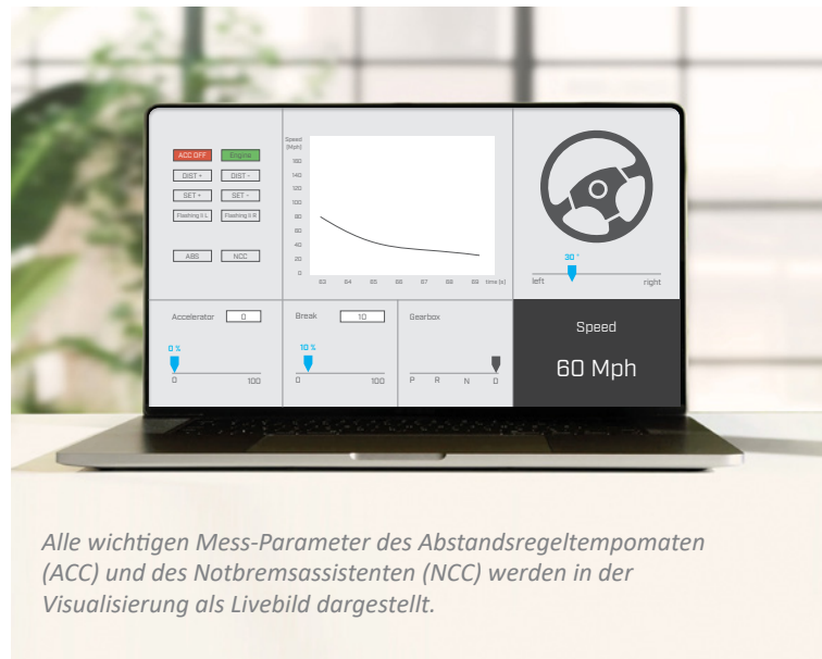
Alle wichtigen Mess-Parameter des Abstandsregeltempomaten (ACC) und des Notbremsassistenten (NCC) werden in der Visualisierung als Livebild dargestellt.

Durch den Einsatz des PCAN-USB Pro FD-Interfaces konnte der Automobilzulieferer die Testkapazitäten erheblich ausweiten und gleichzeitig die Kosten reduzieren. Entwicklungszyklen verkürzten sich, da Tests nun schneller und mit höherer Flexibilität durchgeführt werden konnten. Die Lösung erwies sich als skalierbar, zuverlässig und zukunftssicher und ist heute ein fester Bestandteil bei der Validierung von Fahrerassistenzsystemen.