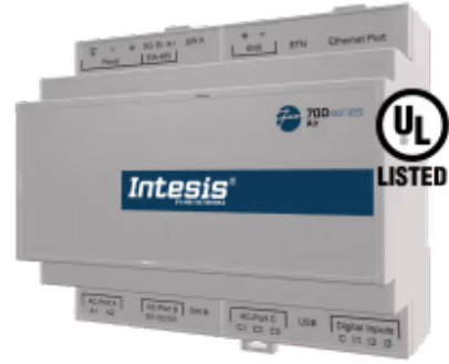
三菱重工到家庭自动化

三菱重工应用程序经过专门设计，允许从家庭自动化系统对三菱重工 VRF 系统进行双向控制和监控。该解决方案允许从单个接口集成多达 128 个室内机。