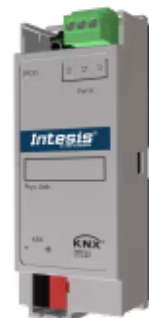
Modbus RTU zu KNX- 100 Punkte

Integrieren Sie jedes Modbus RTU-Servergerät mit jedem KNX-Gerät oder -System über ETS. Diese Integration zielt darauf ab, alle Modbus-Register, -Daten und -Ressourcen von einem KNX-System aus so zugänglich zu machen, als wären sie Teil des KNX-Systems und umgekehrt.