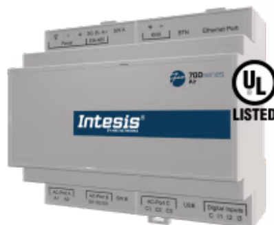
富士通到家庭自动化

富士通应用程序经过专门设计，允许从家庭自动化系统对富士通VRF系统进行双向控制和监控。该解决方案允许从单个接口集成多达 64 台室内机。