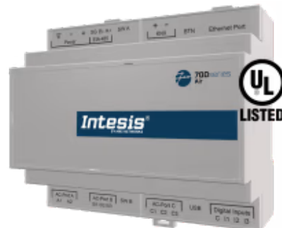
Panasonic zu Modbus TCP/RTU

Die Panasonic-Applikation wurde speziell entwickelt, um die bidirektionale Steuerung und Überwachung von Panasonic ECOi-, PACi-, ECOg/PAC- und VRF-Systemen von einem BMS, SCADA, einer SPS oder einem anderen Gerät aus zu ermöglichen, das als Modbus-Client fungiert. Die Lösung ermöglicht die Integration von bis zu 64 Innengeräten über eine einzige Schnittstelle.