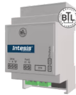
M-BUS zu BACnet/IP

Integrieren Sie jedes M-Bus-Gerät mit einem BACnet/IP-BMS oder -Controller. Diese Integration zielt darauf ab, M-Bus-Geräte, ihre Register und Ressourcen von einem BACnet-basierten Steuerungssystem oder Gerät aus so zugänglich zu machen, als wären sie Teil des BACnet-Systems und umgekehrt.