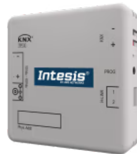
Hitachi zu KNX - 1 AW Inneneinheit

Die Hitachi-KNX-Schnittstelle ermöglicht eine vollständige bidirektionale Kommunikation zwischen Hitachi Air to Water Klimageräten und KNX-Installationen. Er wird direkt an die Inneneinheit angeschlossen und bietet vollständige Interoperabilität mit KNX.