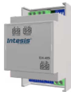
Bosch Commercial zu Modbus RTU - 8 Innengeräte

Das Bosch-Modbus-Gateway ermöglicht die bidirektionale Kommunikation zwischen Bosch-Commercial- und VRF-Systemen sowie Modbus RTU-Netzwerken (RS-485) und ermöglicht die vollständige Steuerung und Überwachung des Klimageräts über seine internen Variablen.