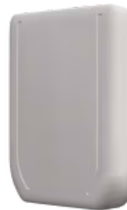
Daikin zu AC Cloud Control - 1 Inneneinheit

Das AC Cloud Control-Gerät für Daikin ermöglicht eine vollständige und natürliche Integration von Daikin-Domestic-Klimageräten in das AC Cloud Control-System für eine professionelle HLK-Steuerung und -Überwachung über eine native Android/iOS-App oder ein Web-Dashboard. Die Konfiguration erfolgt über WLAN oder Bluetooth.