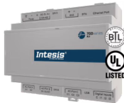
Daikin zu BACnet/IP & MS/TP - Bis zu 16 Inneneinheiten

Die Daikin-Applikation wurde speziell entwickelt, um die bidirektionale Steuerung und Überwachung von Daikin HLK (DIII-NET) von einem BMS, SCADA, einer SPS oder einem anderen Gerät aus zu ermöglichen, das als BACnet/IP-Server oder BACnet MS/TP-Client fungiert. Die Lösung ermöglicht die Integration von bis zu 16 Innengeräten über eine einzige Schnittstelle.