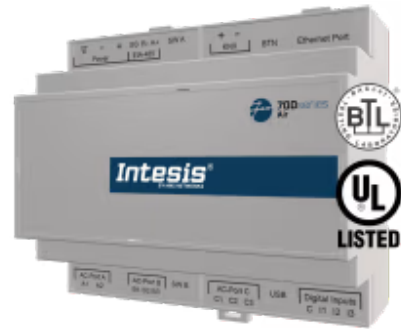
大金到 BACnet/IP & MS/TP - 多达 16 个室内机

大金应用程序经过专门设计, 允许从BMS、SCADA、PLC或任何其他作为BACnet / IP服务器或BACnet MS / TP客户端的设备双向控制和监控大金HVAC (DIII-NET)。该解决方案允许从单个接口集成多达 16 个室内机。