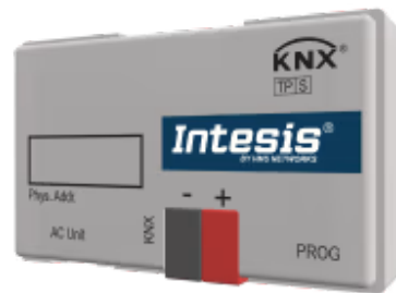
Mitsubishi Electric Domestic zu KNX

Die Mitsubishi Electric-KNX-Schnittstelle ermöglicht eine vollständige bidirektionale Kommunikation zwischen Mitsubishi Electric Domestic-, Mr. Slim- und City Multi-Klimageräten und KNX-Installationen. Sie wird direkt an die Inneneinheit angeschlossen und bietet vollständige Interoperabilität mit KNX.