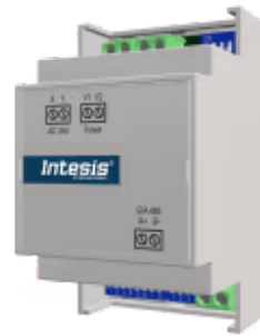
Bosch zu Modbus - 1 Inneneinheit

Die Bosch-Modbus-Schnittstelle ermöglicht eine vollständige bidirektionale Kommunikation zwischen Bosch Commercial- und VRF-Systemen und Modbus RTU-Netzwerken (RS-485). Die Schnittstelle fungiert als Servergerät für die Installation und greift auf alle Signale des Klimageräts zu.