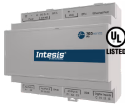
Daikin zu Modbus TCP/RTU - Bis zu 4 Inneneinheiten

Die Daikin-Applikation wurde speziell entwickelt, um die bidirektionale Steuerung und Überwachung von Daikin-Klimaanlagen (DIII-NET) von einem BMS, SCADA, einer SPS oder einem anderen Gerät, das als Modbus-Client fungiert, zu ermöglichen. Die Lösung ermöglicht die Integration von bis zu 4 Innengeräten über eine einzige Schnittstelle.