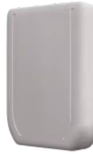
富士通 转 AC 云控制

富士通的空调云控制机组允许将富士通RAC和VRF系统完全自然地集成到空调云控制系统中，通过CN端口直接连接，通过原生Android/iOS应用程序或Web仪表板进行专业的HVAC控制和监控。通过Wi-Fi或蓝牙进行配置。