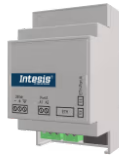
M-BUS zu Modbus TCP - 20 Geräte

Integrieren Sie jedes M-Bus-Gerät in ein Modbus-TCP-BMS oder einen Modbus-TCP-Controller. Diese Integration zielt darauf ab, M-Bus-Geräte, ihre Register und Ressourcen von einem Modbus-basierten Steuerungssystem oder Gerät aus so zugänglich zu machen, als wären sie Teil des Modbus-Systems und umgekehrt.