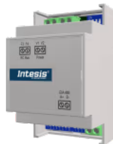
Samsung zu Modbus RTU - 1 Inneneinheit

Die Samsung-Modbus-Schnittstelle ermöglicht eine vollständige bidirektionale Kommunikation zwischen Samsung NON-NASA-Klimageräten und Modbus RTU-Netzwerken (RS-485). Die Schnittstelle fungiert als Servergerät für die Installation und greift auf alle Signale des Klimageräts zu. Auch eine kabelgebundene Fernbedienung kann Teil des Netzwerks sein.