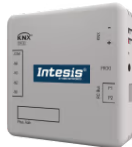
Daikin zu KNX

Die Daikin-KNX-Schnittstelle ermöglicht eine vollständige bidirektionale Kommunikation zwischen Daikin VRV- und Sky-Systemen sowie KNX-Installationen. Sie verfügt über vier potentialfreie Binäreingänge zur Einbindung externer Geräte (z. B. Fensterkontakte oder Präsenzmelder) mit den entsprechenden internen Funktionen zur Verbesserung der Energieeffizienz.