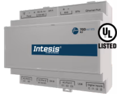
富士通到家庭自动化 - 多达 4 台室内机

富士通应用程序经过专门设计，允许从家庭自动化系统对富士通VRF系统进行双向控制和监控。该解决方案允许从单个界面集成多达 4 个室内机。