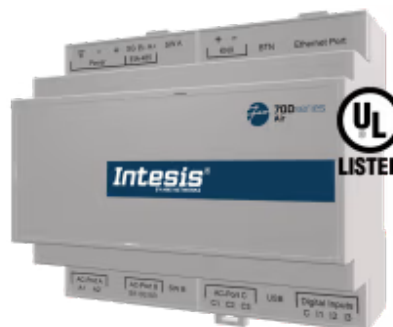
Hisense zu KNX - bis zu 4 Innengeräte

Die Hisense-Applikation wurde speziell entwickelt, um die bidirektionale Steuerung und Überwachung von Hisense VRF-Systemen von einer KNX-Installation aus zu ermöglichen. Die Lösung ermöglicht die Integration von bis zu 4 Innengeräten über eine einzige Schnittstelle.