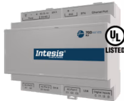
Panasonic zu KNX - bis zu 4 Inneneinheiten

Die Panasonic-Applikation wurde speziell entwickelt, um die bidirektionale Steuerung und Überwachung von Panasonic ECOi-, PACi-, ECOg/PAC- und VRF-Systemen von einer KNX-Installation aus zu ermöglichen. Die Lösung ermöglicht die Integration von bis zu 4 Innengeräten über eine einzige Schnittstelle.