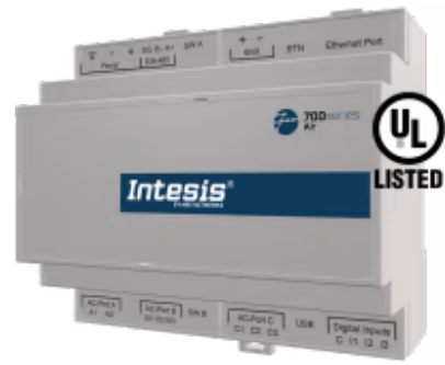
松下到家庭自动化 - 多达 4 台室内机

Panasonic 应用程序经过专门设计，允许从家庭自动化系统对 Panasonic ECOi、PACi、ECOg / PAC、VRF 系统进行双向控制和监控。该解决方案允许从单个界面集成多达 4 个室内机。