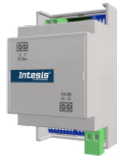
Mitsubishi Heavy Industries zu Modbus - 1 Inneneinheit

Die Mitsubishi Heavy Industries-Modbus-Schnittstelle ermöglicht eine vollständige bidirektionale Kommunikation zwischen Mitsubishi Heavy Industries FD- und VRF-Systemen und Modbus RTU-Netzwerken (RS-485). Die Schnittstelle fungiert als Servergerät für die Installation und greift auf alle Signale des Klimageräts zu. Auch eine kabelgebundene Fernbedienung kann Teil des Netzwerks sein.