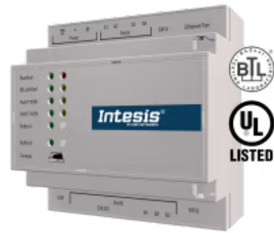
M-BUS zu BACnet/IP & MS/TP - 20 Geräte

Integrieren Sie jedes M-Bus-Gerät in ein BACnet-BMS oder einen beliebigen BACnet IP- oder BACnet MS/TP-Controller. Diese Integration zielt darauf ab, M-Bus-Geräte, ihre Register und Ressourcen von einem BACnet-basierten Steuerungssystem oder Gerät aus so zugänglich zu machen, als wären sie Teil des BACnet-Systems und umgekehrt.