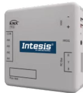
LG zu KNX

Die LG-KNX-Schnittstelle ermöglicht eine vollständige bidirektionale Kommunikation zwischen LG VRF-Systemen und KNX-Installationen. Sie verfügt über vier potentialfreie Binäreingänge zur Einbindung externer Geräte (z. B. Fensterkontakte oder Präsenzmelder) mit den entsprechenden internen Funktionen zur Verbesserung der Energieeffizienz.