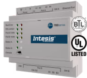
KNX 转 BACnet/IP 和 MS/TP

将任何KNX设备或安装与BACnet BMS或任何BACnet/IP或BACnet MS/TP控制器集成。这种集成旨在使基于BACnet的控制系统或设备可以访问KNX通信对象和资源，就像它们是BACnet系统的一部分一样，反之亦然。