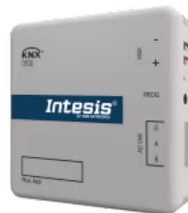
Haier zu KNX

Das Haier-KNX-Gateway ermöglicht die bidirektionale Kommunikation zwischen Haier Commercial- und VRF-Systemen sowie KNX-Installationen. Diese Kommunikation ermöglicht die vollständige Steuerung des Klimageräts über KNX, einschließlich der Überwachung der internen Variablen des Klimageräts, des Betriebsstundenzählers (zur Steuerung der Filterwartung) und der Fehlercodes.