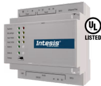
M-BUS zu Modbus TCP & RTU

Integrieren Sie jedes M-Bus-Gerät in ein Modbus-BMS oder einen Modbus TCP- oder Modbus RTU-Controller. Diese Integration zielt darauf ab, M-Bus-Geräte, ihre Register und Ressourcen von einem Modbus-basierten Steuerungssystem oder Gerät aus so zugänglich zu machen, als wären sie Teil des Modbus-Systems und umgekehrt.