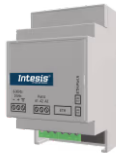
Modbus RTU zu Modbus TCP -32 Geräte

Integrieren Sie Geräte in einem Modbus RTU-Netzwerk mit einem Modbus-TCP-Netzwerk transparent mit unserem kompakten Modbus-Router. Diese Integration zielt darauf ab, Modbus RTU-Geräte, -Register und -Ressourcen für ein Modbus-TCP-Client-BMS oder einen Modbus-TCP-Controller zugänglich zu machen.