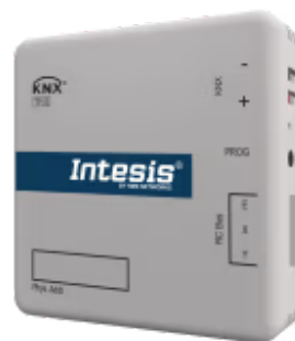
Midea zu KNX

Die Midea-KNX-Schnittstelle ermöglicht eine vollständige bidirektionale Kommunikation zwischen Midea Commercial- und VRF-Systemen sowie KNX-Installationen. Sie wird direkt an die Inneneinheit angeschlossen und bietet vollständige Interoperabilität mit KNX.