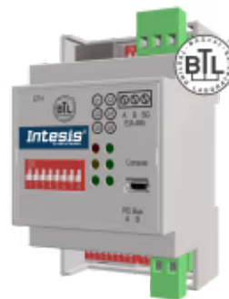
Hitachi zu BACnet/IP & MS/TP

Die Hitachi-BACnet-Schnittstelle ermöglicht eine vollständige bidirektionale Kommunikation zwischen Hitachi VRF-Einheiten und BACnet/IP- oder MS/TP-Netzwerken. Die Schnittstelle ermöglicht die BACnet-Kommunikation über Polling oder Subscription Requests (COV), wodurch die Inneneinheit über unabhängige BACnet-Objekte verfügbar wird. Es kann auch eine kabelgebundene Fernbedienung angeschlossen werden.