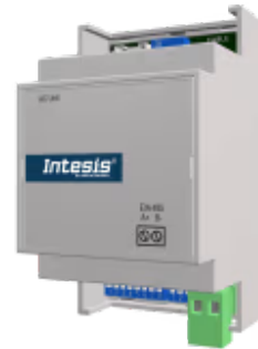
Mitsubishi Electric Domestic zu Modbus - 1 Inneneinheit

Die Mitsubishi Electric-Modbus-Schnittstelle ermöglicht eine vollständige bidirektionale Kommunikation zwischen Mitsubishi Electric Domestic-, Mr. Slim- und City Multi-Klimageräten und Modbus RTU-Netzwerken (RS-485). Die Schnittstelle fungiert als Servergerät für die Installation und greift auf alle Signale des Klimageräts zu.