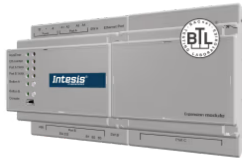
PROFINET zu BACnet/IP & MS/TP

Mit dem Intesis BACnet-PROFINET-Gateway können Sie SPS/BMS-Systeme und die damit verbundenen Geräte nahtlos zwischen BACnet/IP- und MS/TP-Steuerungssystemen und PROFINET-Netzwerken verbinden. Das Gateway arbeitet auf der BACnet-Seite als BACnet-Server und auf der PROFINET-Seite als PROFINET-I/O-Gerät und wird über das Intesis MAPS-Konfigurationstool konfiguriert.