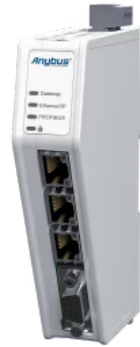
连接 EtherNet/IP 和 PROFIBUS DP 控制系统的协议转换器

Anybus 网关 – EtherNet/IP适配器到PROFIBUS DP设备使您能够将任何EtherNet/IP控制系统连接到任何PROFIBUS控制系统。Anybus 网关可确保不同工业网络之间的可靠、安全、高速数据传输。得益于我们直观的基于 Web 的用户界面，它们也非常易于使用。