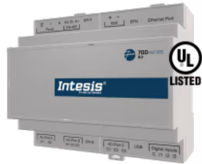
Fujitsu 转 Modbus TCP/RTU - 多达 4 台室内机

富士通应用程序经过专门设计，允许从BMS、SCADA、PLC或任何其他作为Modbus客户端工作的设备对富士通VRF系统进行双向控制和监控。该解决方案允许从单个界面集成多达4个室内机。