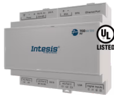
Hisense zu Home Automation

Die Hisense-Applikation wurde speziell entwickelt, um die bidirektionale Steuerung und Überwachung von Hisense VRF-Systemen von einem Home Automation System aus zu ermöglichen. Die Lösung ermöglicht die Integration von bis zu 64 Innengeräten über eine einzige Schnittstelle.