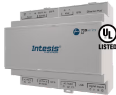
Hisense zu Modbus TCP/RTU

Die Hisense-Applikation wurde speziell entwickelt, um die bidirektionale Steuerung und Überwachung von Hisense VRF-Systemen von einem BMS, SCADA, einer SPS oder einem anderen Gerät aus zu ermöglichen, das als Modbus-Client arbeitet. Die Lösung ermöglicht die Integration von bis zu 64 Innengeräten über eine einzige Schnittstelle.