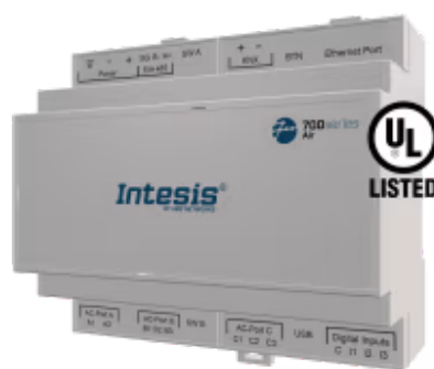
松下转 Modbus TCP/RTU

Panasonic 应用程序经过专门设计，允许从 BMS、SCADA、PLC 或任何其他用作 Modbus 客户端的设备对 Panasonic ECOi、PACi、ECOg / PAC、VRF 系统进行双向控制和监控。该解决方案允许从单个接口集成多达 64 台室内机。