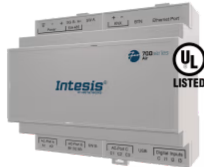
Panasonic zu Modbus TCP/RTU

Die Panasonic-Applikation wurde speziell entwickelt, um die bidirektionale Steuerung und Überwachung von Panasonic ECOi-, PACi-, ECOg/PAC- und VRF-Systemen von einem BMS, SCADA, einer SPS oder einem anderen Gerät aus zu ermöglichen, das als Modbus-Client fungiert. Die Lösung ermöglicht die Integration von bis zu 64 Innengeräten über eine einzige Schnittstelle.