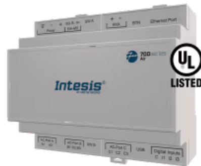
Hitachi zu Modbus TCP/RTU

Die Hitachi-Applikation wurde speziell entwickelt, um die bidirektionale Steuerung und Überwachung von Hitachi VRF-Systemen von einem BMS, SCADA, einer SPS oder einem anderen Gerät aus zu ermöglichen, das als Modbus-Client fungiert. Die Lösung ermöglicht die Integration von bis zu 64 Innengeräten über eine einzige Schnittstelle.