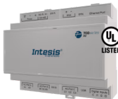
Hitachi zu KNX

Die Hitachi-Applikation wurde speziell für die bidirektionale Steuerung und Überwachung von Hitachi VRF-Systemen von einer KNX-Installation aus entwickelt. Die Lösung ermöglicht die Integration von bis zu 64 Innengeräten über eine einzige Schnittstelle.