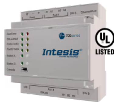
Modbus TCP & RTU zu KNX

Integrieren Sie jedes KNX-Gerät oder jede KNX-Installation in ein Modbus-BMS oder einen Modbus TCP- oder Modbus RTU-Controller. Diese Integration zielt darauf ab, KNX-Kommunikationsobjekte und -ressourcen von einem Modbus-basierten Steuerungssystem oder Gerät aus so zugänglich zu machen, als wären sie Teil des Modbus-Systems und umgekehrt.