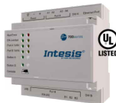
KNX zu Modbus TCP & RTU

Integrieren Sie jedes Modbus RTU- oder TCP-Servergerät oder beides gleichzeitig in jedes KNX-Gerät oder -System. Diese Integration zielt darauf ab, Modbus-Registerdaten und -ressourcen von einem KNX-System aus so zugänglich zu machen, als wären sie Teil des KNX-Systems und umgekehrt.