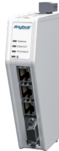
Protokollkonverter zur Anbindung von EtherCAT-Geräten an PROFIBUS-Steuerungen

Mit dem Anybus Communicator EtherCAT MainDevice auf PROFIBUS können Sie EtherCAT-Geräte mit PROFIBUS-Steuerungen verbinden. Anybus Communicator sorgen für zuverlässige, sichere und schnelle Datenübertragungen zwischen verschiedenen industriellen Netzwerken. Dank unserer intuitiven, webbasierten Benutzeroberfläche sind sie außerdem einfach zu bedienen.