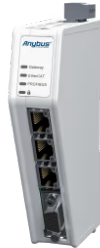
连接 EtherCAT 和 PROFIBUS DP 控制系统的协议转换器

Anybus 网关 – EtherCAT从站到PROFIBUS DP设备使您能够将任何EtherCAT控制系统连接到任何PROFIBUS控制系统。Anybus 网关可确保不同工业网络之间的可靠、安全、高速数据传输。得益于我们直观的基于 Web 的用户界面，它们也非常易于使用。