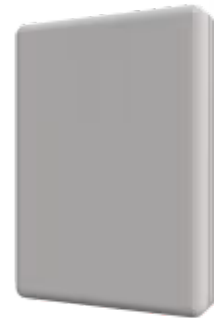
Daikin zu Home Automation

Das Daikin-ASCII-Gerät ermöglicht die vollständige und natürliche Integration von Daikin VRV- und Sky-Systemen in IP-basierte Home Automation Systeme. Das Gerät wird über ein direktes Kabel mit der Inneneinheit und über Wi-Fi mit der Home Automation Schnittstelle verbunden. Es kann auch eine kabelgebundene Fernbedienung angeschlossen werden.