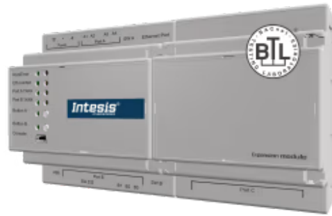
PROFINET 转BACnet/IP 和 MS/TP

Intesis BACnet-PROFINET网关允许您在BACnet/IP和MS/TP控制系统与PROFINET网络之间无缝互连PLC/BMS系统及其连接的设备。网关在BACnet端作为BACnet服务器，在PROFINET端作为PROFINET I/O设备，并通过Intesis MAPS配置工具进行配置。