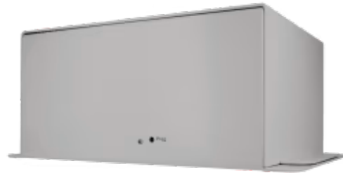
Toshiba zu KNX - 16 Inneneinheiten

Die Toshiba-Schnittstelle wurde speziell entwickelt, um die bidirektionale Steuerung und Überwachung von Toshiba VRF-Systemen von einer KNX-Installation aus zu ermöglichen. Das Gateway wird direkt mit dem Kommunikationsbus der Außeneinheit verbunden und ermöglicht die Steuerung aller an das System angeschlossenen Inneneinheiten.