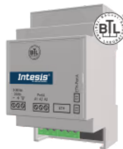
ST Cloud Control zu BACnet MS/TP oder IP oder Modbus RTU und TCP

Intesis ST Cloud Control ist eine bidirektionale Cloud-basierte Lösung zur Überwachung und Steuerung beliebiger BACnet- oder Modbus-Geräte – über ein webbasiertes Dashboard oder eine endbenutzerorientierte App. Die Lösung ermöglicht die Integration von bis zu 32 Geräten, mit bis zu 12 Widgets pro Gerät. Widgets können zwischen den Geräten, die mit demselben Gateway verbunden sind, gemeinsam genutzt/aufgeteilt werden.